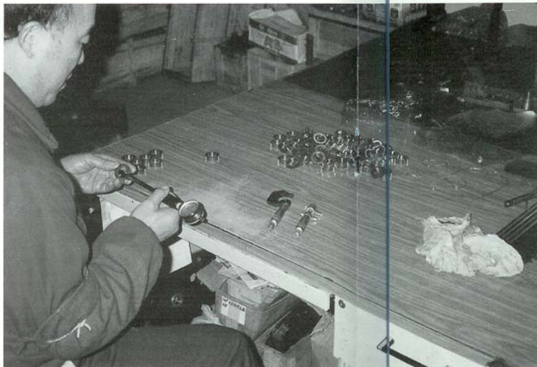
Het enige extraatje dat Chinese werknemers kunnen binnenhalen is een bonus voor goed presteren. Wie beneden de maat heeft gepresteerd kan met een boete worden bestraft.

Goedkope werknemers Azië zit economisch in een dip, dus ook voor Chinese werknemers hangt de vlag er op dit moment