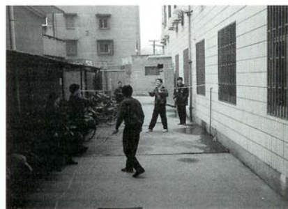
Nog even een potje badminton, na de dagelijkse run op de snackbar om klokslag half twaalf.

900 RMB, oftewel tussen de 100 en 225 gulden (1 RMB is f 0,25). Grafici komen maandelijks thuis met 750 tot 1.200 RMB, oftewel 180 tot 300 gulden. Mogelijkheden om wat extraatjes bij elkaar te sprokkelen zijn beperkt. Overwerk wordt niet betaald. Als de standaard werktijd uitloopt, gebeurt dat met gesloten beurzen. Overwerk is 'vrijwillig'. 'Vrijwilligers' worden overigens wel door de baas aangewezen en weigeren is hoogst ongebruikelijk. Want de baas tegenspreken doet je niet in China. Het enige extraatje dat Chinese werknemers kunnen binnenhalen