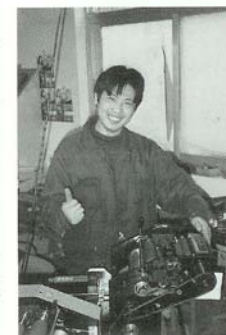
Grafische werknemers hebben een relatief goede positie op de arbeidsmarkt.

Getrouwen komen niet in aanmerking voor een woning van de baas. Die moeten ze zelf zien te vinden. De meeste getrouwde stellen wonen in een flat die ze zelf hebben gekocht. Aan de 'luxe' van dergelijke woningen, zoals een douche, kun je zien dat het de woning van een getrouwd stel betreft.